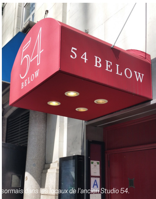
Un restaurant - cabaret, le 54 Below, se tient désormais dans les locaux de l'ancien Studio 54.